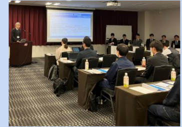
事業者交流会イメージ