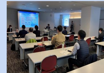
外部説明会イメージ