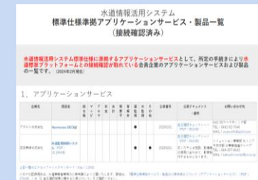
公表サイトイメージ