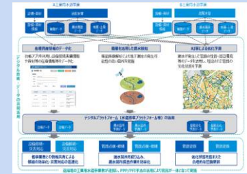
第14回 産業構造審議会 工業用水道政策小委員会 資料2